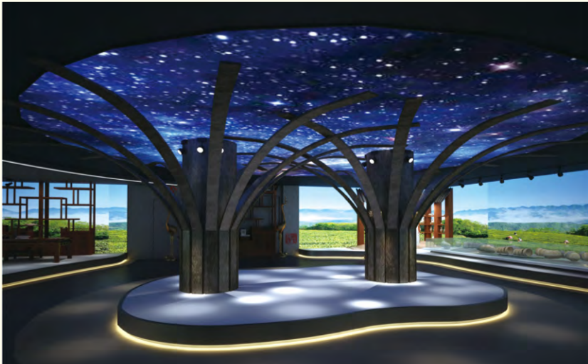
漆心可见(马王堆专题展馆改造设计) 赵宇佳