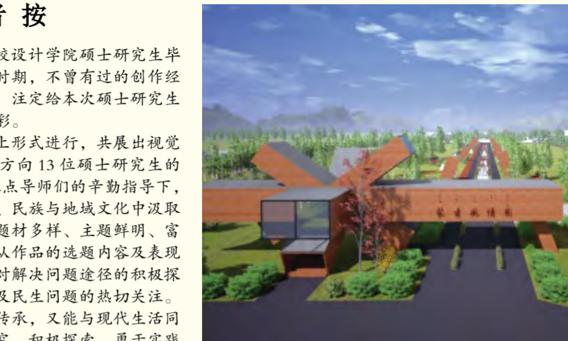
牧歌(蒙古风情园旅游景区景观设置) 张家豪