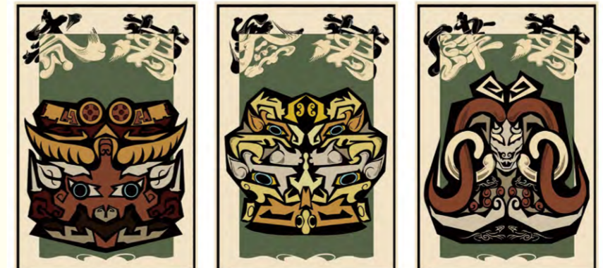
万子牌(纸牌牌面设计展示) 李鑫