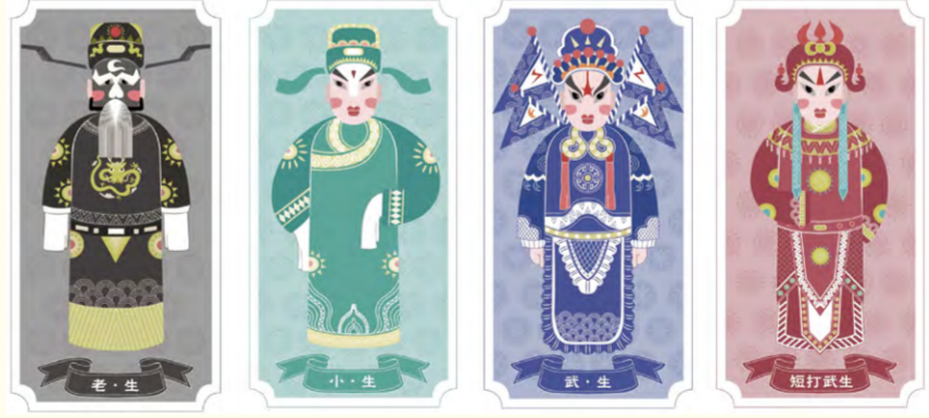
河北梆子人物形象文创设计 贾兴宇