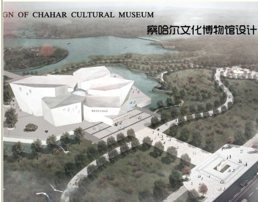
察哈尔文化博物馆 陶拉