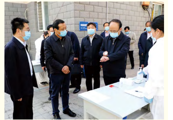
内蒙古自治区政府副主席郑宏范深入我校实地督导检查疫情防控和新学期开学准备工作

本报讯 4月8日上午,内蒙古自治区政府副主席郑宏范在自治区教育厅党组成员、副厅长成涛的陪同下,深入我校实地督导检查疫情防控和新学期开学准备工作。我校党委书记刘前贵、校长黄海、党委副书记赵海忠、副校长蔡广志陪同督查。