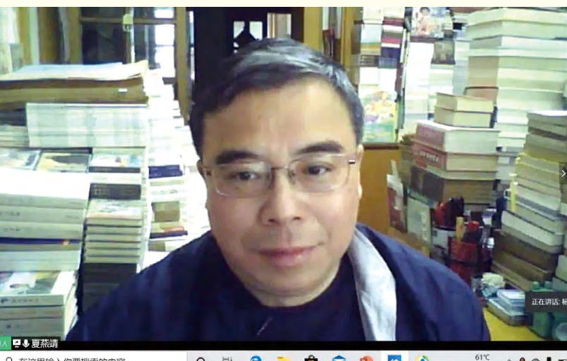
南京艺术学院博士生导师夏燕靖教授在线讲座