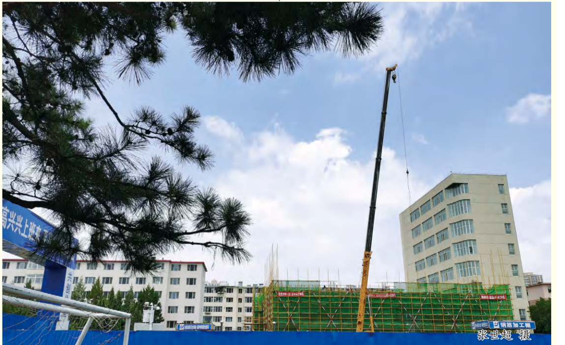
封面图片:建设中的我校图书馆二期工程

按照检查评估工作组的指导意见,对存在的问题和不足立行立改,安全有序地做好学校错峰开学的各项准备工作。