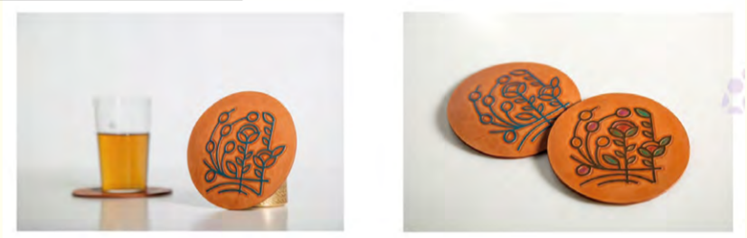
和恩琪迹(品牌文创产品设计实践 纪念品系列产品) 高汀