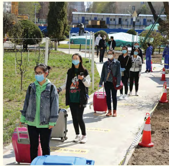
我校举行2020年春季开学复课疫情防控应急处置全要素演练

课疫情防控工作给予了肯定。同时,也对个别细节上的欠缺提出了整改意见和建议。学校领导表示,将