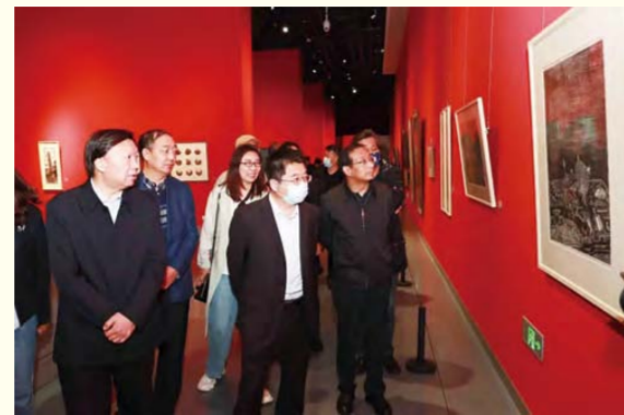
刘前贵书记、黄海院长参观学生优秀作品

本报讯 5月20日上午，内蒙古美术馆展厅人潮涌动，由内蒙古艺术学院、内蒙古师范大学共同举办的2022年“民族团结一家亲 同心共筑中国梦”学生优秀作品联展隆重开幕，共展出中国画、油画、版画、水彩、雕塑、